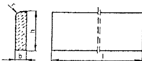
Rysunek 1. Kształt betonowego obrzeża chodnikowego

Kształt obrzeży betonowych przedstawiono na rysunku 1, a wymiary podano w tablicy 1.